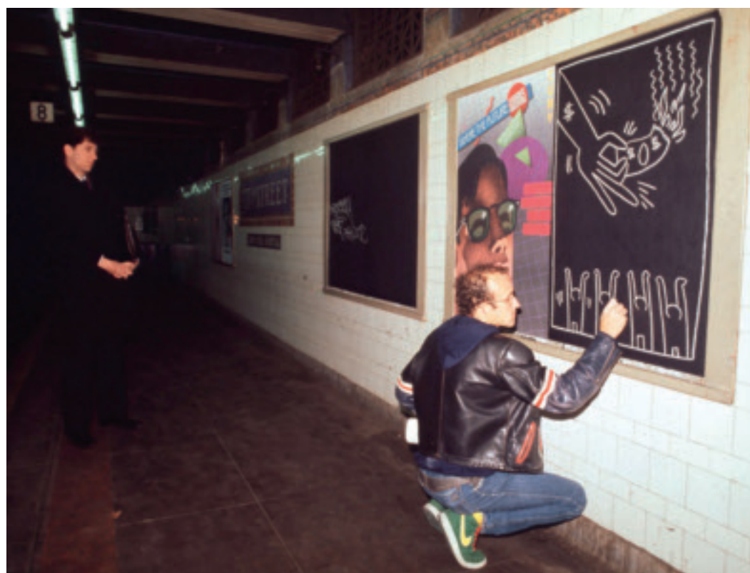
Tseng Kwong Chi, Keith Haring dessinant dans le métro de New York (1985). Tseng Kwong Chi, Keith Haring drawing in the New York subway (1985).