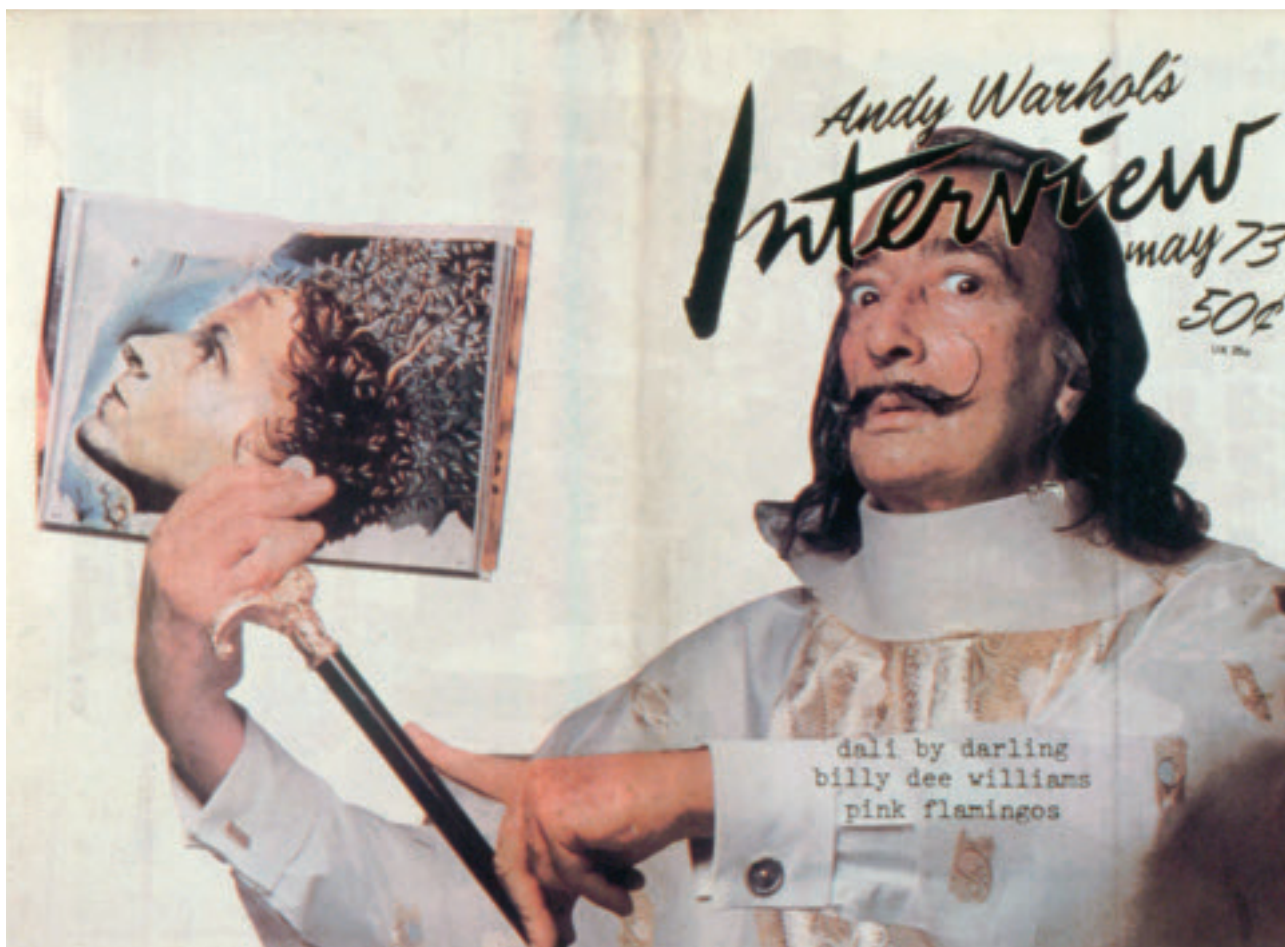
Cover from Andy Warhol's Interview magazine, May 1973, featuring Salvador Dalí. Courtesy Interview Enterprises Inc. Couverture du magazine Interview d'Andy Warhol, mai 1973, montrant Salvador Dalí. Avec l'autorisation de Interview Enterprises Inc.

By all accounts the auction was a well-timed coup on the part of Damien Hirst who would later be ranked #1 on ArtReview magazine's "Power 100" list for 2008. Artworks and documentation from Beautiful Inside My Head Forever are a highlight of Pop Life: Art in a Material World , organized by Tate Modern, London, and presented this summer at the National Gallery of Canada. The exhibition tells the story of how a recent generation of artists born of the combined influence of Pop Art, Conceptualism, the ready-made, and – especially in Hirst's case – a healthy dose of do-it-yourself resolve, have asserted themselves as power brokers in the contemporary art world with a cachet and celebrity often extending much further. Pop Life features more than 200 works of art by some of the world's most renowned visual artists including Hirst, Jeff Koons, Richard Prince, Keith Haring, Martin Kippenberger, Tracey Emin, Maurizio Cattelan, and Takashi Murakami. Using measured parts talent, marketing and the mass media, the artists in Pop Life have brazenly engaged the sociological terrain of contemporary life, landing on the same page – literally – as more ubiquitous cultural producers such as actors, filmmakers, sports heroes and rock stars. In so doing, they have eschewed the avant-garde orthodoxy that to be a serious artist means categorically avoiding the trappings of mainstream success.