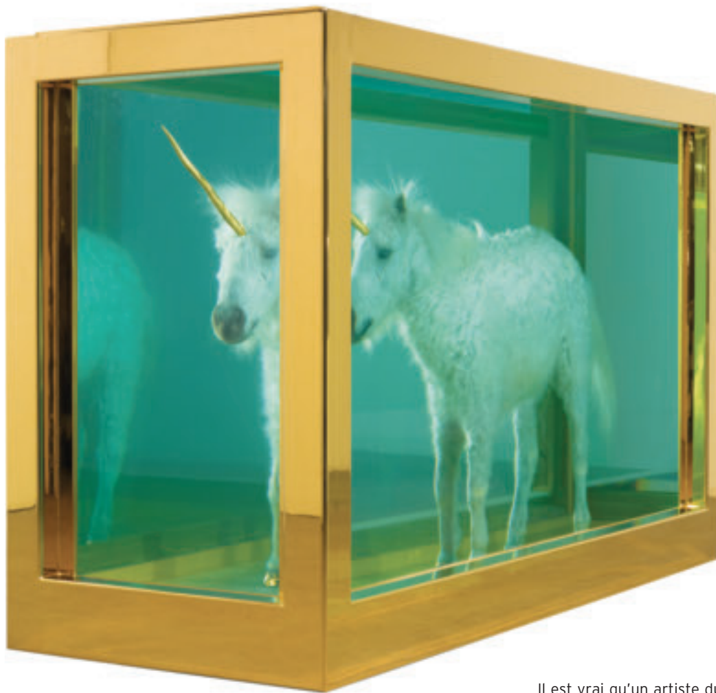
Damien Hirst, Le rêve d'enfance (2008), 167 × 231,2 × 96 cm. Collection de Science Ltd. Damien Hirst, The Child's Dream (2008), 167 × 231,2 × 96 cm. Collection of Science Ltd. © Damien Hirst / SODRAC (2010)