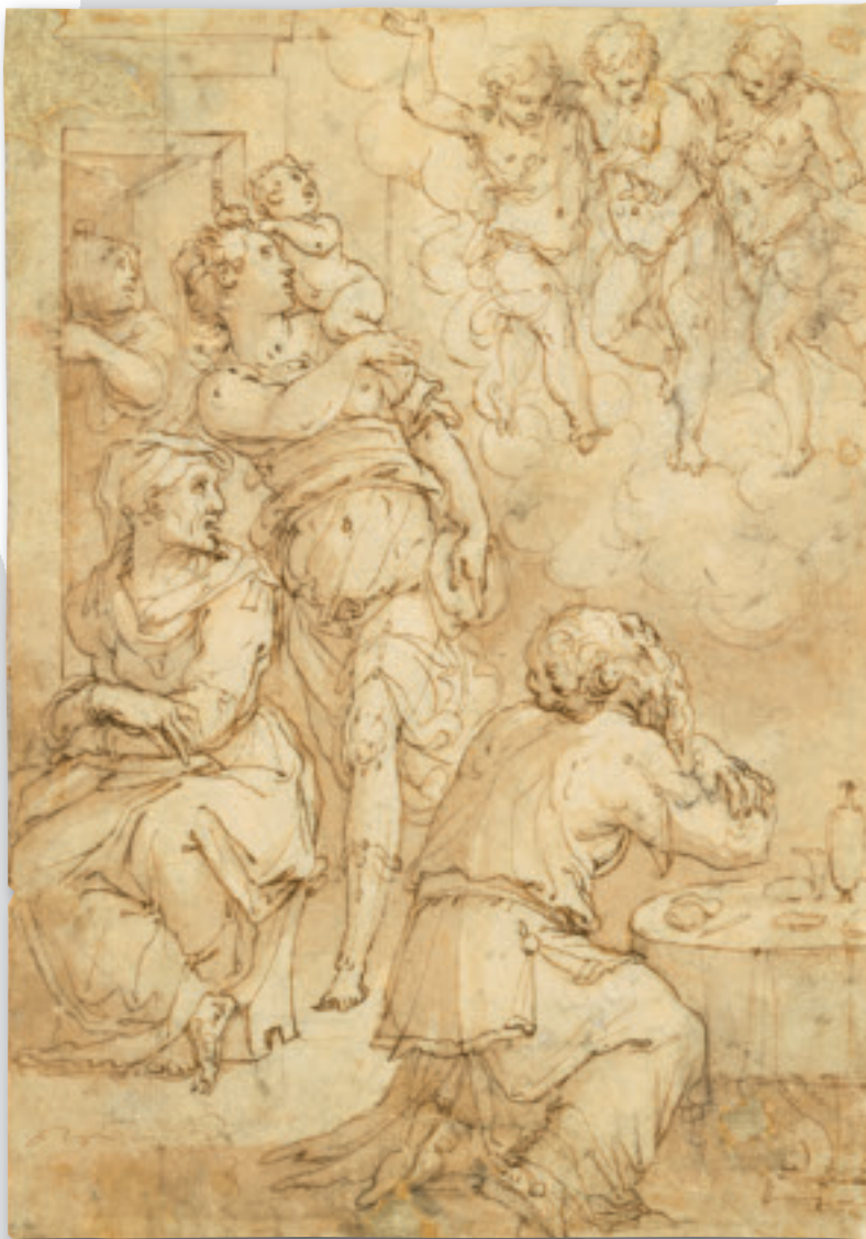
Giorgio Vasari, Three Angels Appearing to Abraham (1570), 22.1 x 15.7 cm, NGC. Gift of Sidney and Gladys Bregman, Toronto (2000) Giorgio Vasari, Trois anges se montrant à Abraham (1570), 22,1 x 15,7 cm, MBAC. Don de Sidney et Gladys Bregman, Toronto (2000)